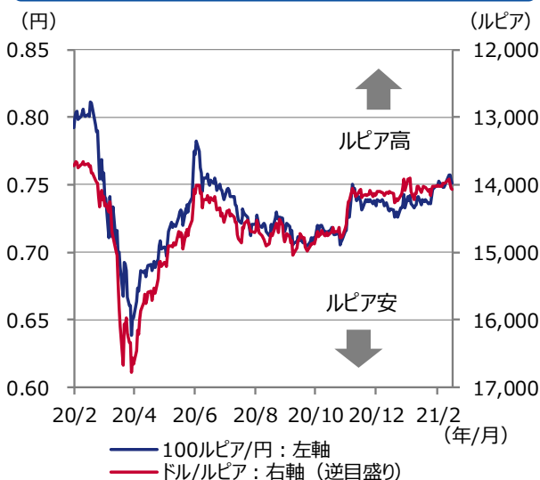
図表2 インドネシアルピアの推移

期間：2020年2月3日～2021年2月18日（日次）