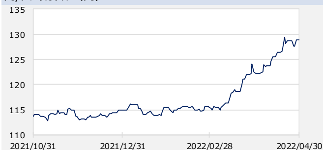
円/アメリカドル (円)