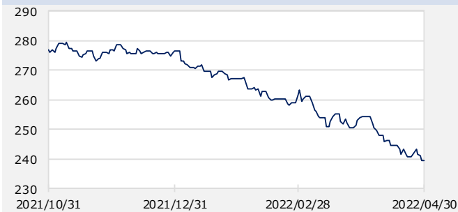
米国社債インデックス (円ヘッジベース)