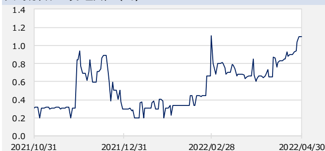
アメリカドル ヘッジコスト (%)