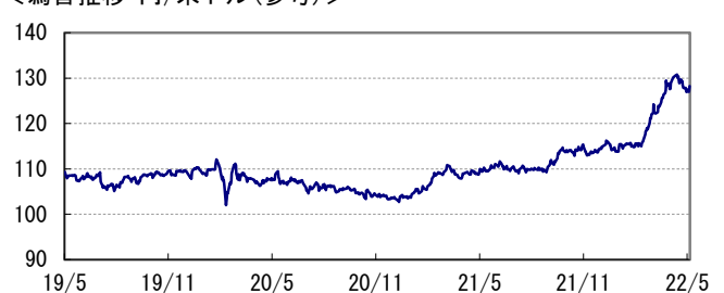
<為替推移 円/米ドル(参考)>

※当レポート中の各数値は四捨五入して表示している場合がありますので、それを用いて計算すると誤差が生じることがあります。