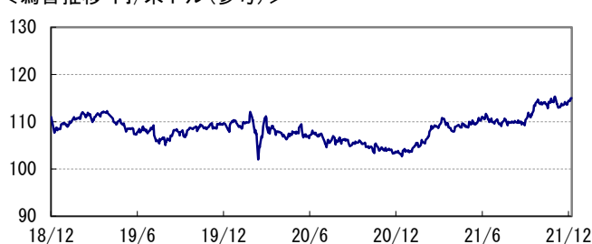
<為替推移 円/米ドル(参考)>

※当レポート中の各数値は四捨五入して表示している場合がありますので、それを用いて計算すると誤差が生じることがあります。