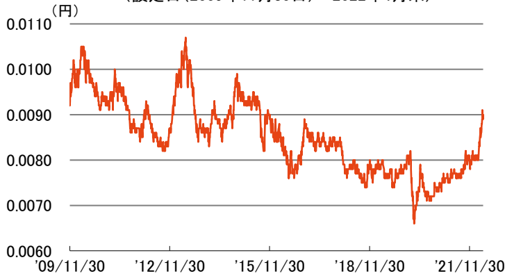
インドネシア・ルピア(対円)の推移 (設定日(2009年11月30日)～2022年4月末)