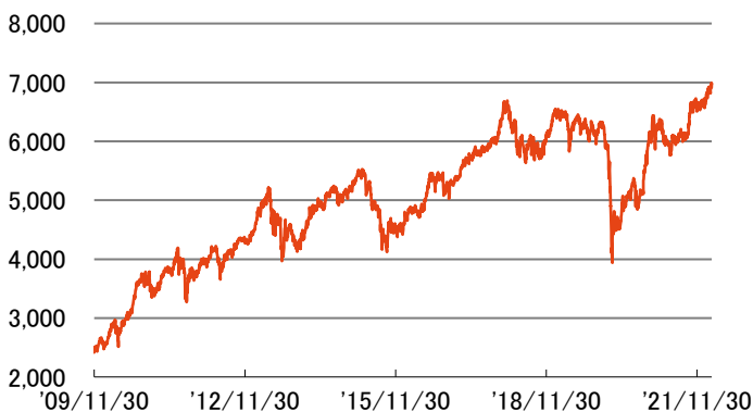
ジャカルタ総合指数の推移 (設定日(2009年11月30日)～2022年4月末)

上記指数は、市場の動きを示すために表示したものであり、ファンドのベンチマークではありません。