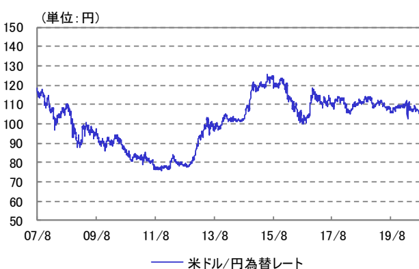
米ドル/円 為替レート 2007/08/13~2020/09/30

※ 設定時2007年8月13日を10,000として指数化しています。 ※ 2016年8月23日まではドイツ銀行グループ商品指数(円建て為替ヘッジなし)を、2016年8月24日からはCRB指数(円建て為替ヘッジなし)を指数化しています。